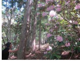
シャクナゲの花がいっぱい咲いています