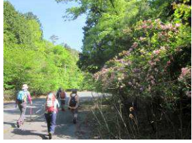
タニウツギの花が咲き誇る道