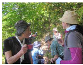
クロモジ茶をいただく