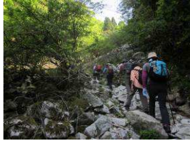
岩場をゆっくり登る