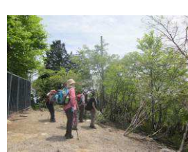
カラ岳から武奈ヶ岳を望む