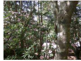
シロヤシオの花がいっぱい咲いています