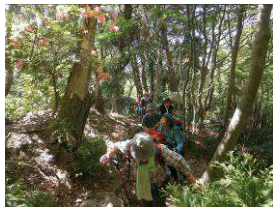
ヤマツツジがきれい