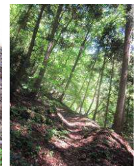
小入谷峠駐車場へ