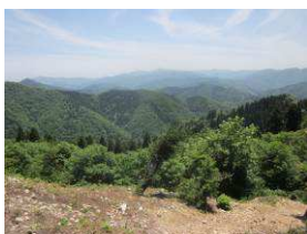
コースからの眺望