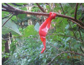
説明ポイントの赤テープ