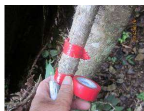
右折・左折の二重テープ