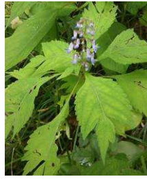
カメハヒキオコシ