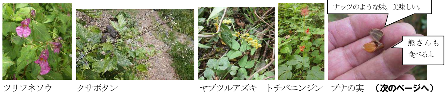
ツリフネソウ クサボタン ヤブツルアズキ トチバニンジン ブナの実 (次のページへ)