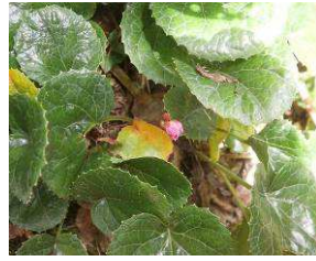
季節外れのイワウチワの蕾