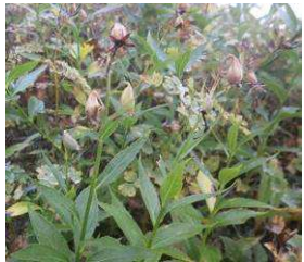
シャジン：花は終わっている