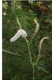
サラシナショウマ