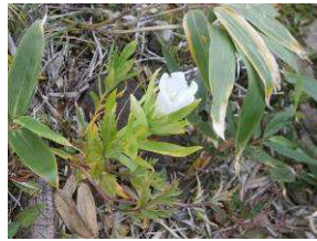
白い花の咲くリンドウ