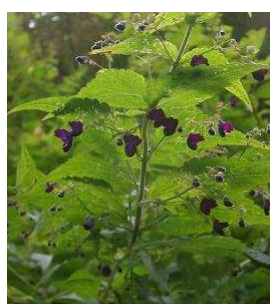
クロバナヒキオコシ