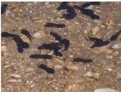
ヤシャゲンゴロウ