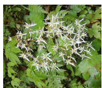
ダイヤモンドソウ