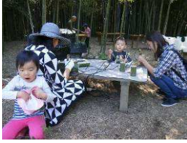
昼食用の竹食器を仕上げています