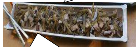
捨てられるイモツルも美味しい惣菜に変身

材料:いもつる 油あげ 塩ふき こんぶ 生シイタケ かつおだし さとう しょうゆ 酒 みりん