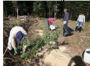
花の苗植え体験② (連福運動)