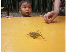
クツワムシがいたよ