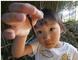
赤トンボを捕まえたよ