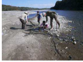
安曇川で、川作り遊び (幼稚園児と小学3年生のお遊び)