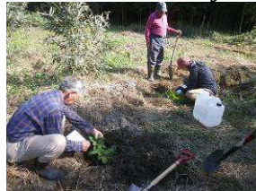
花の苗植え体験① (連福運動)