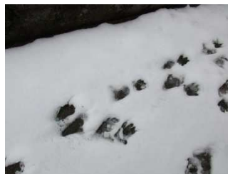
ミトンがいっぱい・・・ 猿の足跡