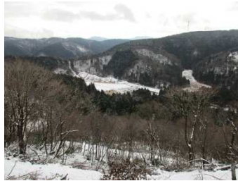
在原集落方面の眺望