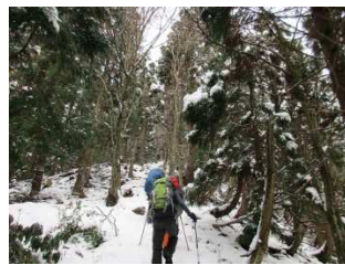
樹木もきれいに雪化粧①