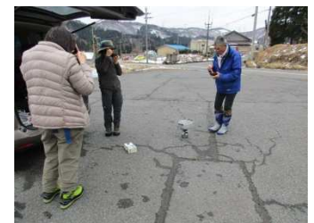
栃ぜんざいを楽しむ