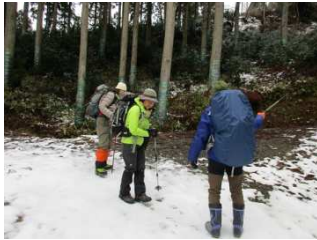
登山口：雪が増えてきます

風もなく穏やかな日和に恵まれ、乗鞍岳の雪山トレッキングを楽しみました。在原集落内は雪もなく、仕方ないなあ……。雪山トレッキングに変更。登って行くにつれ積雪も増え、電波塔ではゴッポリ足が入ってしまい、足を抜くのに一苦労するほどのかなりの量の積雪になりました。雪質も良く、雪景色・眺望も素晴らしく、この時期ならではの自然を楽しみました。下山後は、いつもの通り、高島名物の“栃餅ぜんざい”を楽しみました。帰りに道の駅藤樹の里あどがわによりお土産購入など楽しみました。