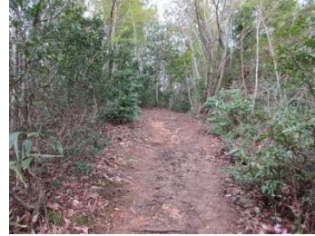
トレッキングコース