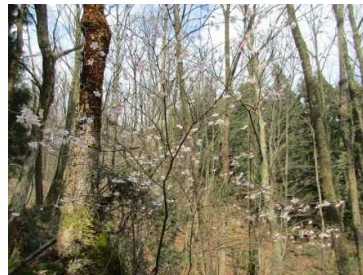
キンキマメザクラ