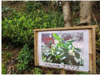
あちこち自生してる“ナニワズ”

はじめての山ですが、ナニワズ・カタクリ・キンキマメザクラ・ショウジョウバカマ・キクザキイチゲなど早春の花々が楽しめて楽しいコースです。また、とても雰囲気の良い山です。また、ナニワズ（ジンチョウゲ科）は、私は初めて見ますが、たくさん自生していて見応えがあります。皆さまのご参加をお待ちしています。