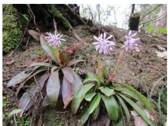
ショウジョウバカマ