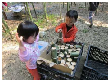
竹コップで積木「？」遊び