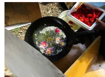
ヤブツバキの天ぷら