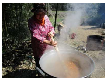
笑湖カレーライス