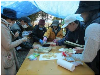
丸めていただきます