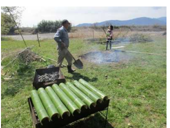
手作り炭で炊きます