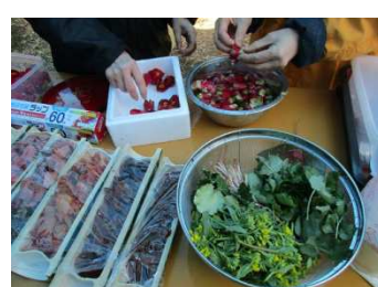
②と手づくり漬けもの あつあつのうちにいただきます