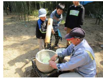
ヨモギ餅もつきます①