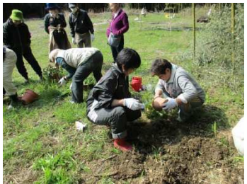
竹林整備②：花の苗植え①