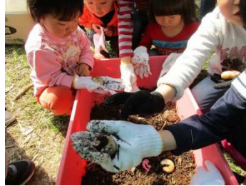
カブトムシの観察①