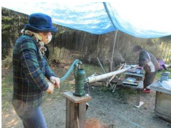
取り外し式でイベント時のみ設置