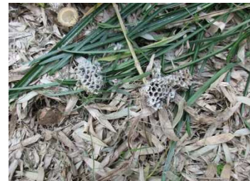
ハチの巣が落ちていたよ