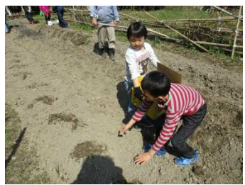
じゃがいも植え※注1 エンドウ豆の苗植え※注2