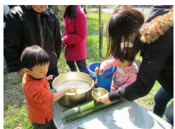
竹釜のお米を入れます