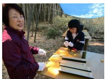
竹細工① 今日使うお昼御飯の竹食器を仕上げます