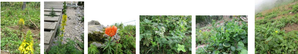
メタラコウ キンミズヒキ コオニユリ キスタソウ ヤマガラシ キバナハタザオ