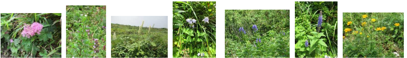
シモツケソウ イワアカバナ サラシナショウマ ツリガネニンジン イブキトリカブト ルリトラノオ キンバイソウ