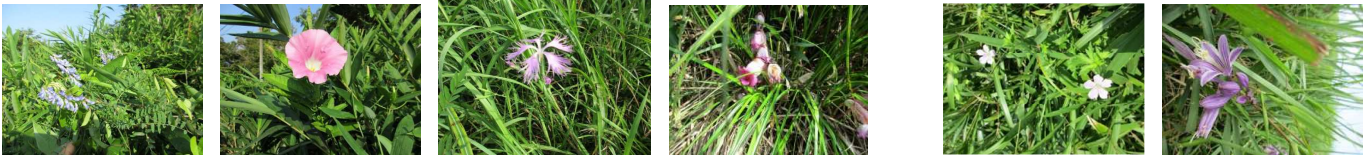
クサフジ ヒルガオ カワラナデシコ オオナンパンギセル ハクサンフウロ コバギボシ