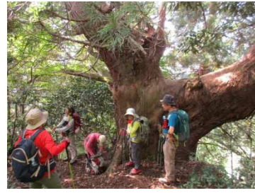
アシュウ杉の巨木前で