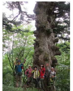
大モミ：樹齢500年以上