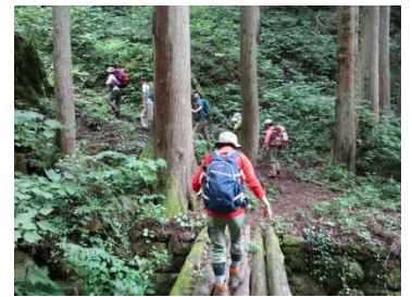
木の橋：気をつけて