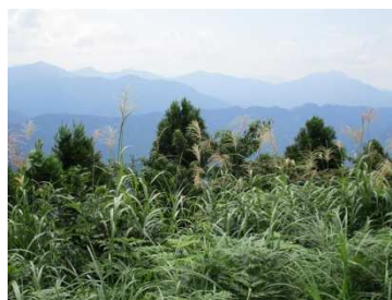
展望所からの眺望①