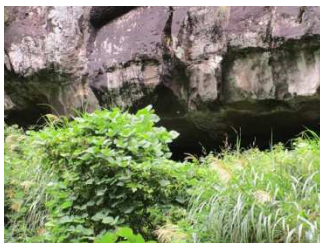
こもり穴：平家伝説あり