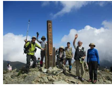
武奈ヶ岳 1214m にて