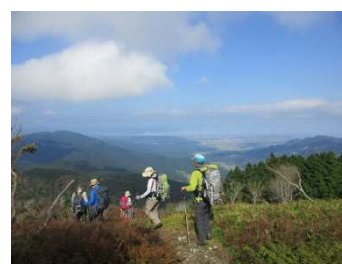
眺望を楽しみながら